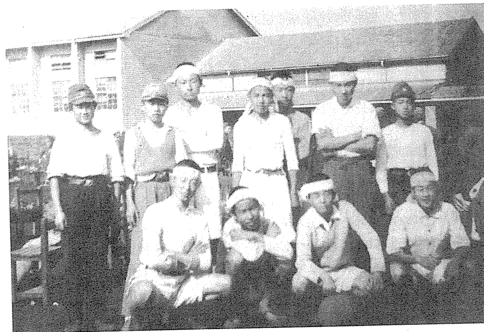
運動会の試合に出場した生徒チームイレブン。帽子をかぶっている者も試合中は鉢巻をし、裸足の者も何名かいた。